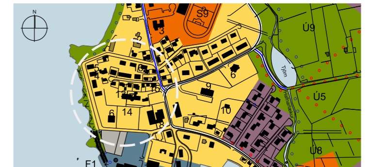
Hluti þéttbýlisuppráttar Þórshafnar Aðalskipulag Langanesbyggðar 2007-2027