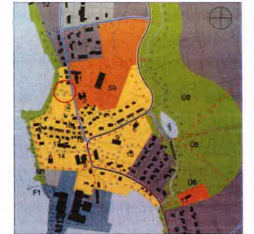
Aðalskipulag Langanesbyggðar 2007-2027 Hluti þéttbýlisuppdráttar Þórshafnar

Samþykkt deiliskipulagsbreytingarinnar var auglýst í B-deild stjórnartíðinda þann _____ 2023.