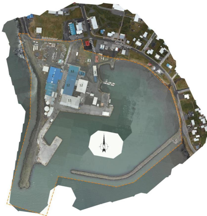
Mynd 1. Sjá má afmörkun skipulagssvæðis með brotalínu.

Skipulagssvæðið er um 20,8 ha og afmarkast af Bakka- og Fjarðarvegi og fjöruborði í norðri, fjöruborði og varnargarði í austri, varnargarði og sjó í suðri og varnargarði og strandlengju í vestri.