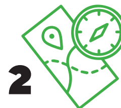
2 Öflugt atvinnulíf