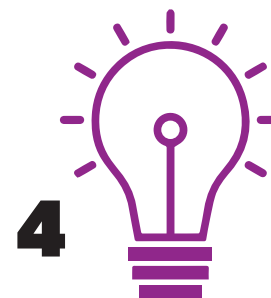
4 Skapandi mannlíf