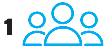
1 Sterkir samfélagsinnviðir