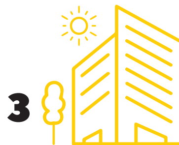
3 Aðlaðandi ímynd Bakkafjarðar