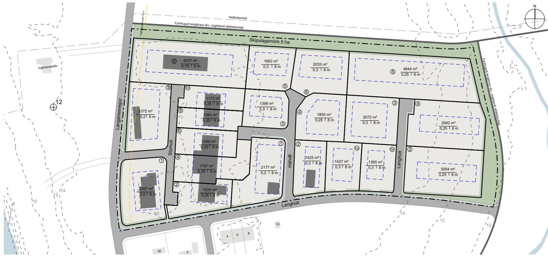
Afmörkun skipulagssvæðis 5 ha ÍSNET93 kortagrunnur Langanesbyggðar Hæðarlínur 2 m